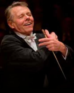
SYMPHONIEORCHESTER DES BAYERISCHEN RUNDFUNKS

Wir folgen Mariss Jansons und dem Symphonieorchester des Bayerischen Rundfunks auf internationale Gastspiele und in weltberühmte Konzertsäle.