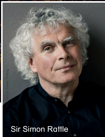
Sir Simon Rattle

Konzertreise nach Paris 01.10. – 04.10.2023