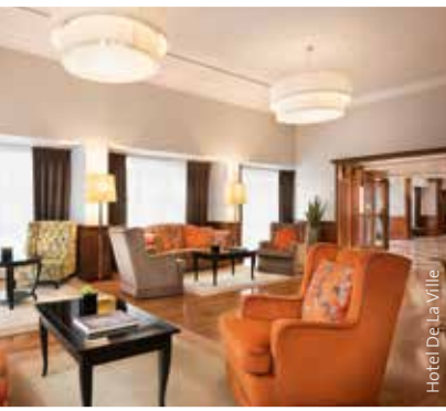
Hotel De La Ville