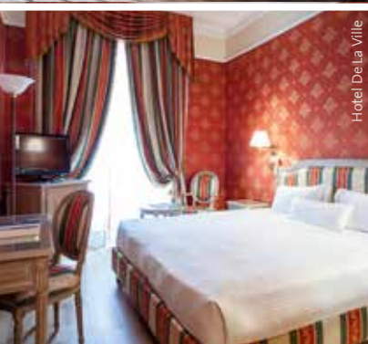
Hotel De La Ville

Es könnte das „Opernereignis des Jahres 2024“ werden: Zur Saisoneroöffnung der Mailänder Scala im Dezember 2024 werden Superstar Anna Netrebko, Jonas Kaufmann und Ludovic Tézier in Verdis Meisterwerk „La forza del destino“ angekündigt. Wie gut, daß wir uns schon im Vorfeld ein kleines Kartenkontingent sichern konnten und wie schön ist es, Mailand einmal in der Adventszeit zu erleben. Mailand ist eine pulsierende Weltstadt, die „heimliche Hauptstadt Italiens“ und berühmt für Mode und Design, Architektur, Musik und Kunst. Mailand ist ein Kraftwerk der Kreativität. Der Ehrgeiz, das Beste und Schönste zu erschaffen, findet hier ebenso Platz wie der entspannte Espresso in der Via Montenapoleone. Unsere Suche nach Kunst, Lebensart und Musik führt uns von Caravaggio bis zur filmreifen Bar. Und ... zum berühmtesten Opernhaus der Welt: die Mailänder Scala, das Mekka der Opernliebhaber. Der Besuch einer Operaufführung in der Mailänder Scala ist für jeden Opernfreund immer wieder aufs Neue ein Hochgenuss und ein ganz besonderes Erlebnis. Sie werden sehen, nichts ist leichter, als der Schönheit dieser wunderbaren Opern-Metropole zu erliegen! Benvenuti a Milano!