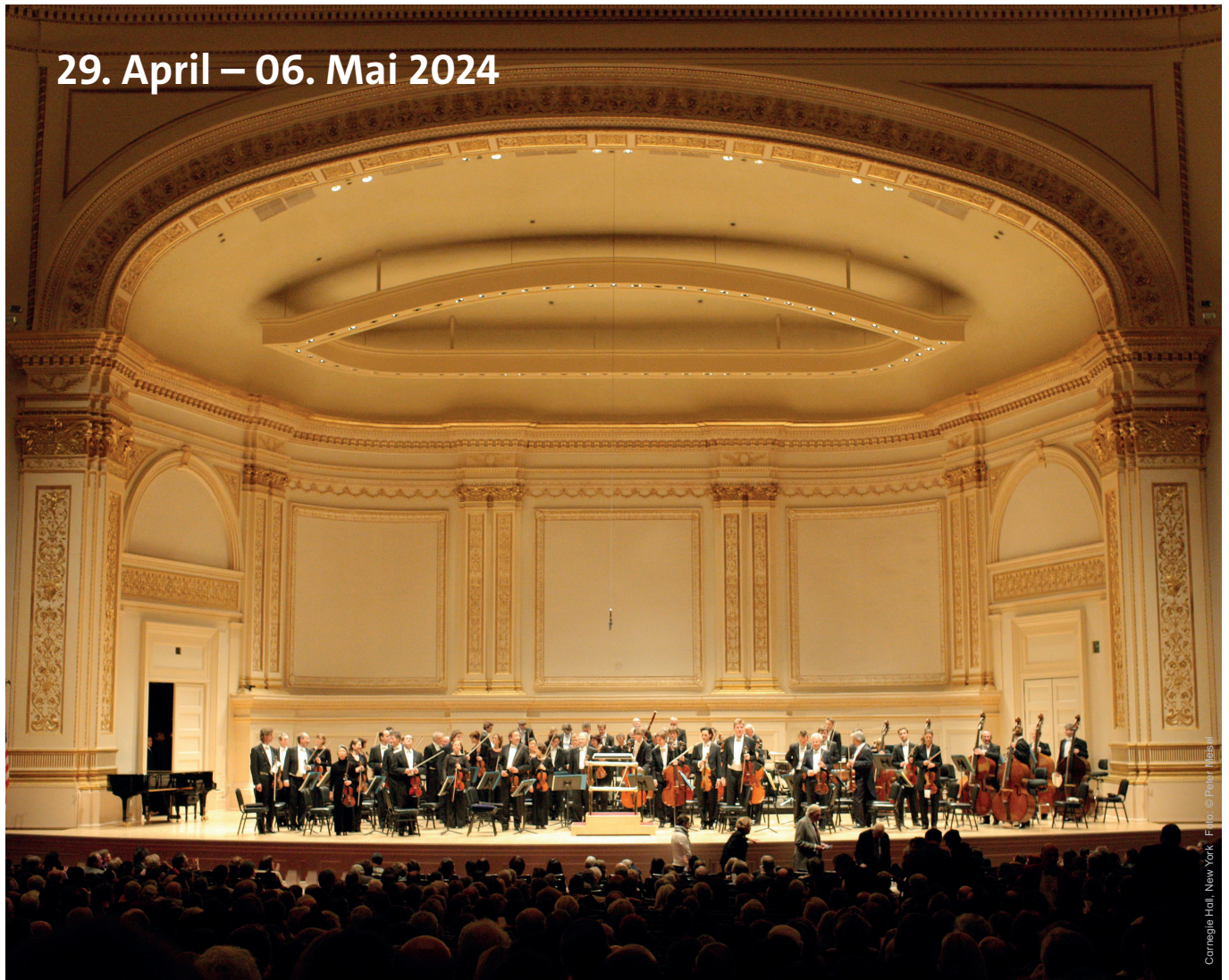
Carregie Hall, New York.