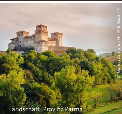
Landschaft: Provinz Parma