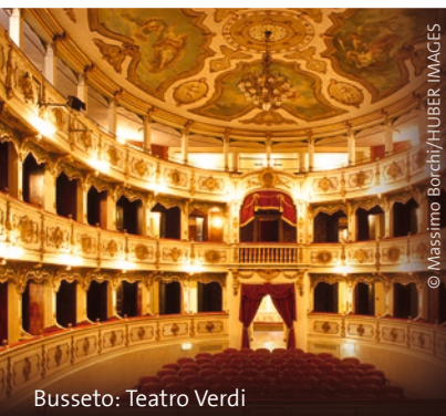
Busseto: Teatro Verdi