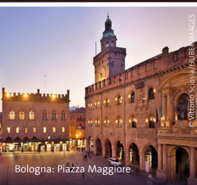
Bologna: Piazza Maggiore

Sie ist schon eine große Verführerin, die Emilia-Romagna! Erinnern Sie sich noch? Hat nicht die Emilia-Romagna auch Ihnen die allererste Begegnung mit der italienischen Küche beschert: etwa mit der über den Tresen gereichten Mortadella-Scheibe von der netten Metzgerin. Oder mit Nudeln und Fleischsauce, Kenner nannten sie damals Bolognese mit stimmhaftem G („Bolognese“). Während Fans der italienischen Küche bei der Stadt Parma sofort an Parmesan und Schinken denken, ist für Musikliebhaber vor allem ein Name damit verbunden: Giuseppe Verdi! Und jedes Jahr im Oktober, zum „compleanno des compositore“ am 10. Oktober, wird groß gefeiert, mit einem Opernfestival natürlich. Das „Verdi-Festival“ will die Partituren des Meisters so originalgetreu wie möglich vorstellen und sein Gesamtwerk pflegen. Neben der bekannten Spielstätte, dem „Teatro Regio“ in Parma, lockt uns in diesem Jahr noch ein ganz besonderes Konzert-Highlight nach Bologna, wo es zu einem Wiedersehen kommt mit dem langjährigen Generalmusikdirektor der Bayerischen Staatsoper und jetzigen Chefdirigenten und Künstlerischen Leiter der Berliner Philharmoniker: Kirill Petrenko! Entdecken Sie mit uns während dieser Reise ein Italien, das Sie vielleicht noch nicht kennen. Viva Italia! Viva Verdi!