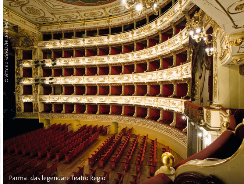
Parma: das legendäre Teatro Regio

entfernt liegt diese malerische Kleinstadt inmitten der fruchtbaren Po-Ebene. Auf dem Weg nach Busseto liegt in Roncole Verdi Geburtshaus, an dem wir auch kurz halten werden. In Busseto schlendern wir unter den Arkaden prächtiger Bürgerhäuser. Gegen 13.30 Uhr fahren wir wieder zurück nach Parma. Individuelles Mittagessen. Der Rest des Nachmittages steht zur freien Verfügung. Um 16.00 Uhr treffen wir uns im Hotel und gehen zu Fuß zum legendären Opernhaus von Parma. Das „Teatro Regio“, 1829 als Nuovo Teatro Ducale eröffnet, ist die Hauptspielstätte des „Verdi Festivals“ und es gilt seit Jahrzehnten als eines der bedeutendsten Theater Italiens. Die „Messa da Requiem“ im „Teatro Regio“ beginnt um 17.00 Uhr. Im Anschluss gemeinsames Abendessen in einem schönen Restaurant.