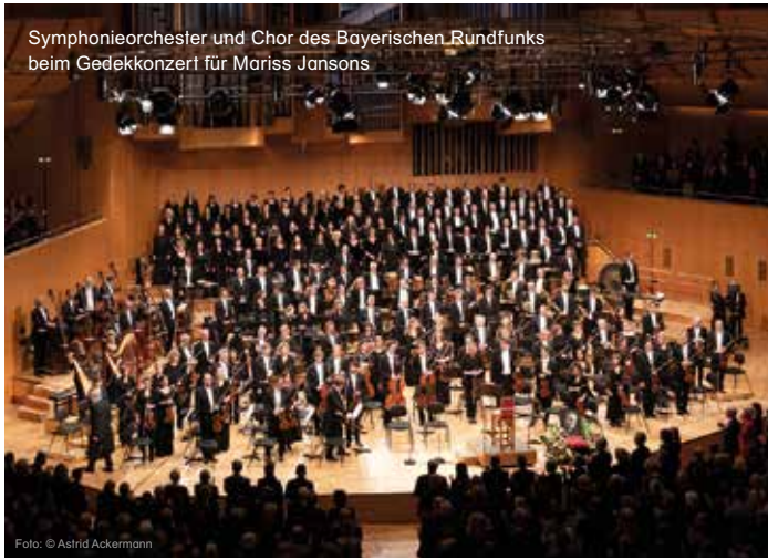
Symphonieorchester und Chor des Bayerischen Rundfunks beim Gedekkonzert für Mariss Jansons