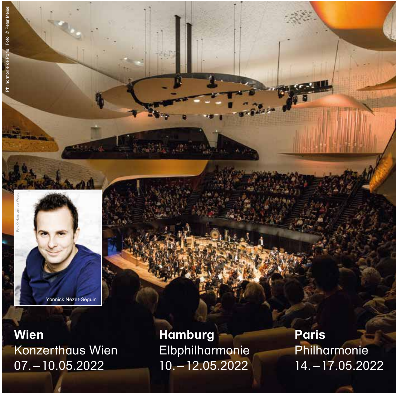
Philharmonie de Paris